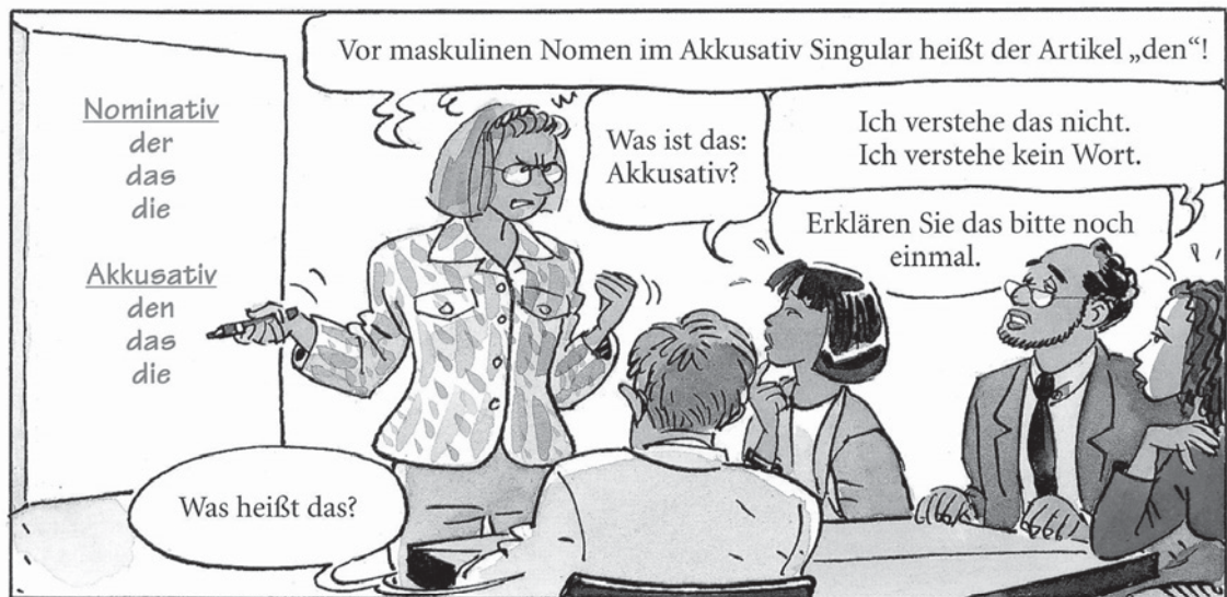
Abb. 3: eurolingua Deutsch 1, S. 90

Schauen Sie das Bild an. Kennen Sie die Situation?